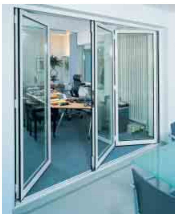
Falt-Schiebetüren für den Innenbereich