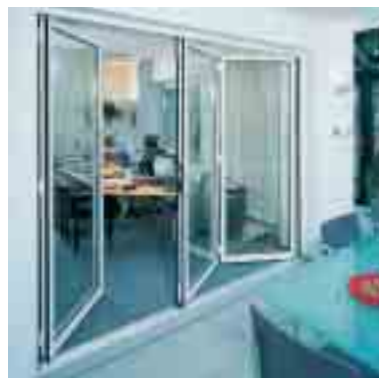
Falt-Schiebetüren Seite 7