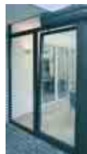
PASK-Tür in Kippstellung