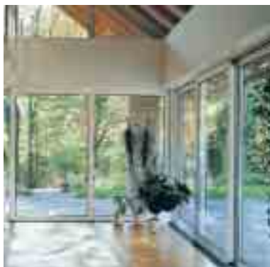
Schiebetüren für Türen und Fenster Seite 4