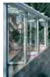
Falttür halb geöffnet