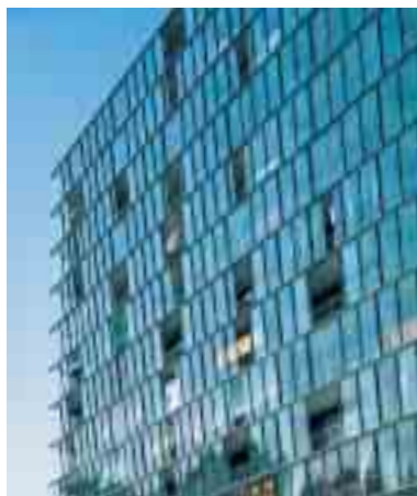
Schiebefenster als Laubengangverglasung

Auch im gewerblichen Bereich sind Schiebelemente überall dort eine praktische und wirtschaftliche Lösung, wo große Öffnungen und/oder viel Licht gewünscht werden.