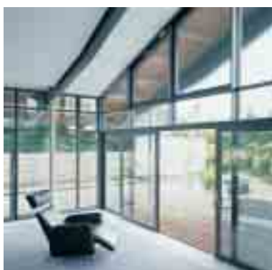
Hebe-Schiebetüren Seite 5