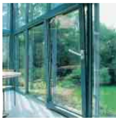
Parallel-Abstell- Schiebe-Kipp-Türen Seite 6